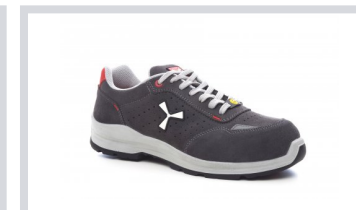
S1005 STEEL GREY