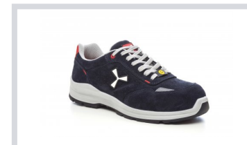
S0301 BLU NAVY