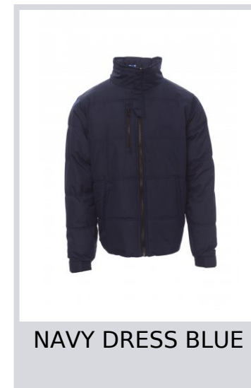
NAVY DRESS BLUE